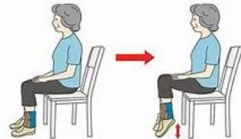
座ってかかと上げ体操